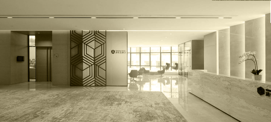
企业成长与危机管理研讨会